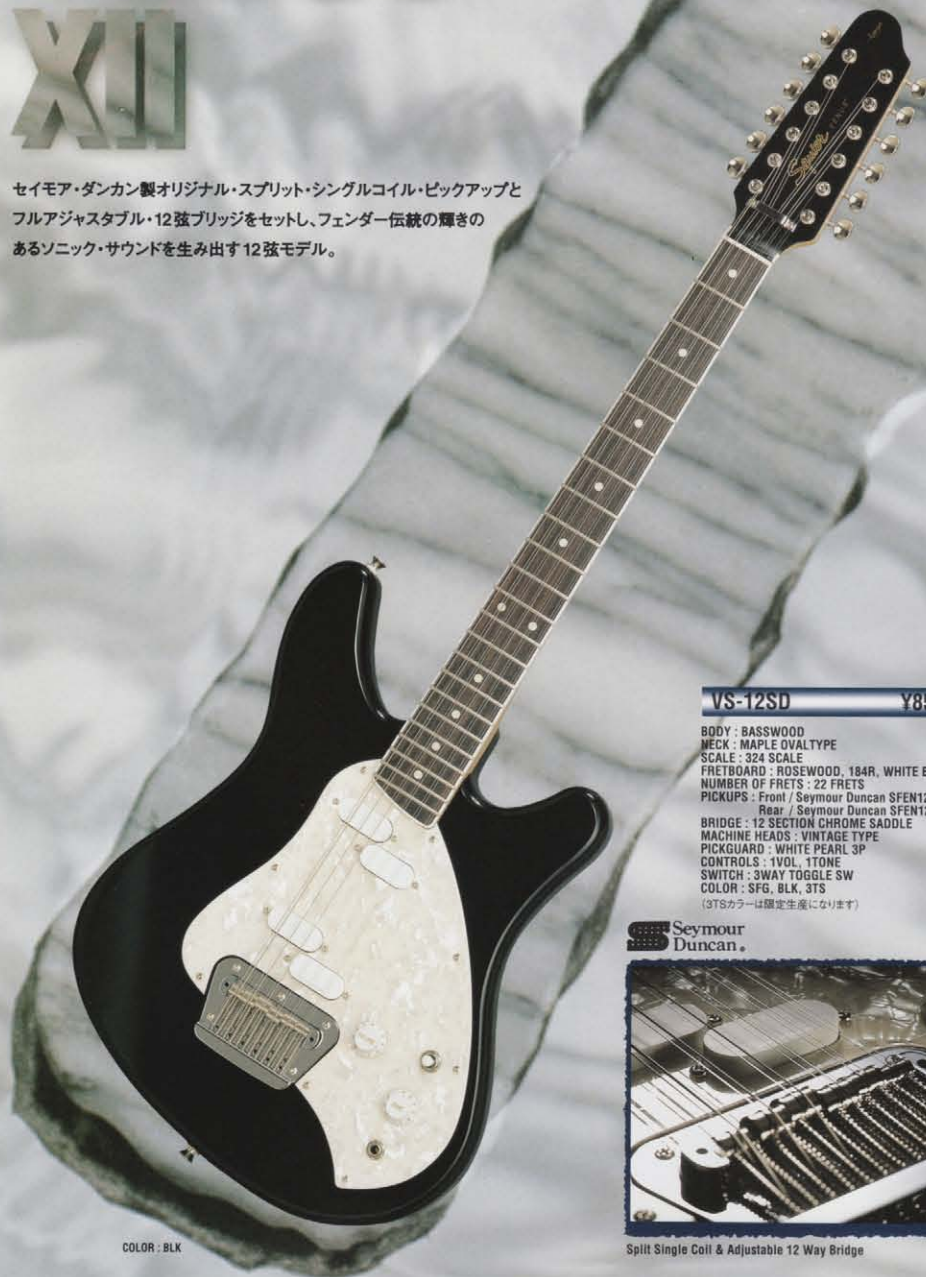
COLOR : BLK

セイモア・ダンカン製オリジナル・スプリット・シングルコイル・ピックアップと フルアジャスタブル・12弦ブリッジをセットし、フェンダー伝統の輝きの あるソニック・サウンドを生み出す12弦モデル。