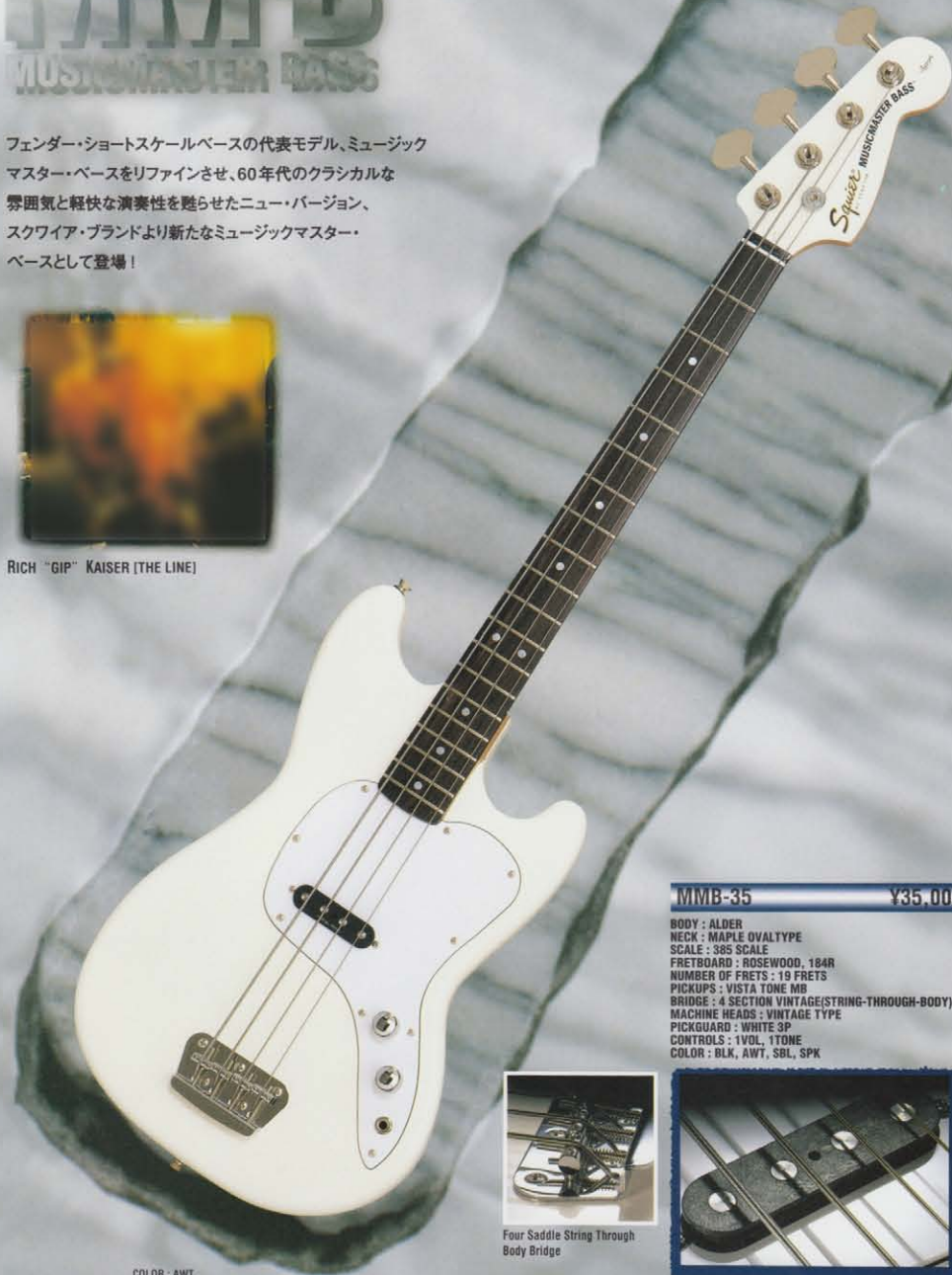
COLOR : AWT