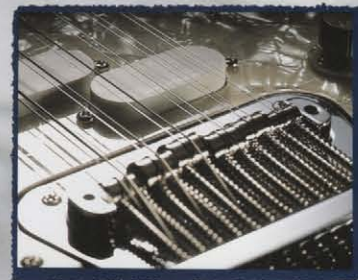
Split Single Coil & Adjustable 12 Way Bridge