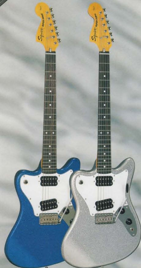
SS-63 COLOR : BSP

(スーパーソニックのコントロールは、リア・ピックアップに近いカリア・ボリュームです。)