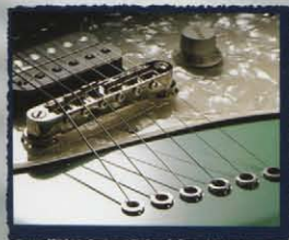
Adjustable Bridge & String Through Body Tailpiece

BODY : BASSWOOD NECK : MAPLE OVALTYPE SCALE : 324 SCALE FRETBOARD : ROSEWOOD, 380R, WHITE BINDING NUMBER OF FRETS : 22 FRETS PICKUPS : Front / ST-VINTAGE Rear / DRAGSTER BRIDGE : TUNE-O-MATIC MACHINE HEADS : VINTAGE TYPE PICKGUARD : WHITE PEARL 3P CONTROLS : 1VOL SWITCH : 3WAY TOGGLE SW COLOR : SFG, BLK, 3TS (3TSカラーは限定生産になります)