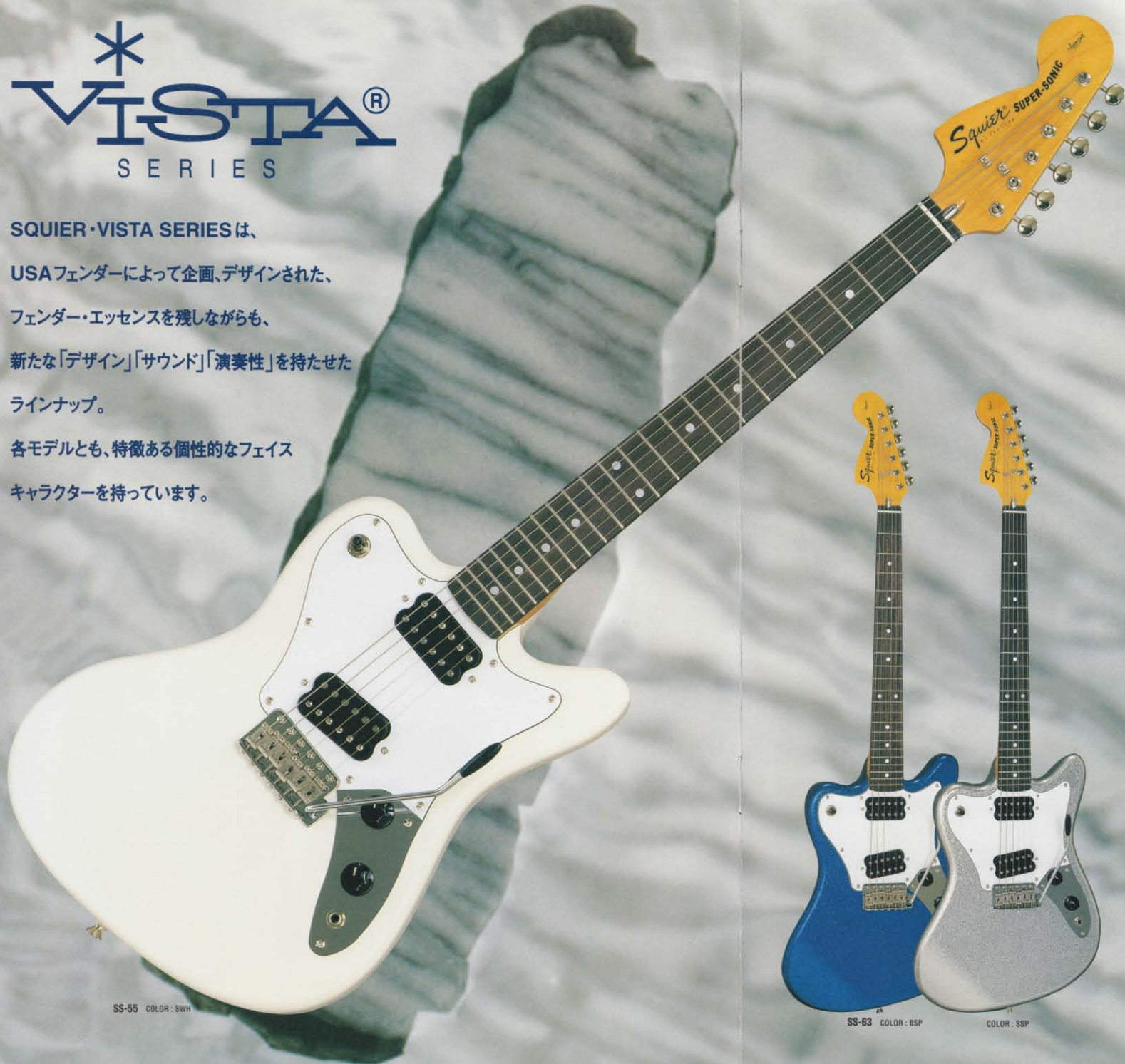
SS-55 COLOR : SWH

SQUIER・VISTA SERIESは、 USAフェンダーによって企画、デザインされた、 フェンダー・エッセンスを残しながらも、 新たな「デザイン」「サウンド」「演奏性」を持たせた ラインナップ。 各モデルとも、特徴ある個性的なフェイス キャラクターを持っています。