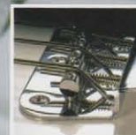
Four Saddle String Through Body Bridge

BODY : ALDER NECK : MAPLE OVALTYPE SCALE : 305 SCALE FRETBOARD : ROSEWOOD, 184R NUMBER OF FRETS : 19 FRETS PICKUPS : VISTA TONE MB BRIDGE : 4 SECTION VINTAGE(STRING-THROUGH-BODY) MACHINE HEADS : VINTAGE TYPE PICKGUARD : WHITE 3P CONTROLS : 1VOL, 1TONE COLOR : BLK, AWT, SBL, SPK