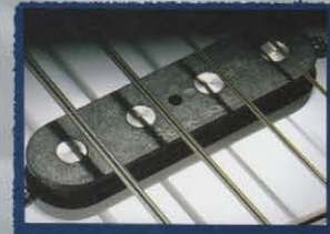
Vista Tone Single Coil Pickup