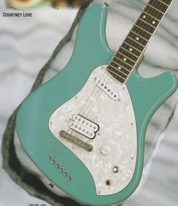
COLOR : SFG