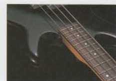
ミディアム・スケール・ネック

ハイポジションでのフィンガリングからストレスを消散し、演奏性を向上させるラウンドカット・ヒールを採用したネック・ジョイント部。ハイクラス・モデル同様の優れた演奏性を約束している。