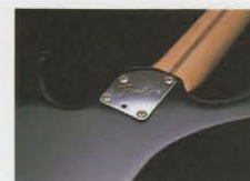
ラウンドカット・ヒール

ハイポジションでのフィンガリングからストレスを消散し、演奏性を向上させるラウンドカット・ヒールを採用したネック・ジョイント部。ハイクラス・モデル同様の優れた演奏性を約束している。