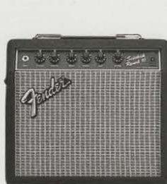
SIDEKICK REVERB 10 ¥28,000 ●出力=10W(RMS) 20W(PEAK) ●スピーカー=8インチ(20センチ)×1 ●コントロール=VOLUME, MASTER, TREBLE, MIDDLE, BASS, REVERB ●外形寸法・重量=345(W)×321(H)×190(D)mm 6.8kg ●消費電力=25W ●ヘッドホン端子、ラインアウト、USAアキュロニクス社製リバーブ装備