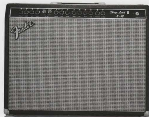
STAGE LEAD II 2-12 ¥120,000 NEW

フェンダースピリッツを雄弁に語りつつ、傑出したサウンドメイクを生成する100ワットアンプ。ステージアンプとしての比類なきクラスを完成し、世界的評価を獲得した Stage Lead II の登場です。3バンドパッシブEQ 装備のAチャンネル、4バンドアクティブEQ 装備のBチャンネルの2チャンネルインプットシステムを採用。A、Bのチャンネルセレクト、A+BミックスA・B単独使用の3タイプのインプットセレクトが可能なおえ、創造力が目をさます3ボリュームシステムの採用、各チャンネル共通のプレゼンス、リバーブコントロールを装備。世界のトッププロを魅了する大型リバーブユニットは高品位を誇るUSAアキュロニクス社製を採用し音の質を高めます。1-12は12インチスピーカー1本、2-12は2本マウントし、ステージングにより選択できる完全プロフェッショナル仕様。フェンダーのニューコンセプト® Stage Lead II®。それぞれのステージで、フェンダーの真価を力強く放ちます。