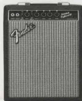
SIDEKICK KEYBOARD 15 ¥29,800

●出力=15W(RMS) 30W(PEAK) ●スピーカー=8インチ(20センチ)×1 ●コントロール=VOLUME×2, REVERB ON/OFF SW×2, BASS, TREBLE, REVERB ●外形寸法・重量=338(W)×427(H)×217(D)mm 8.4kg ●消費電力=38W ●ヘッドホン端子、ラインアウト装備