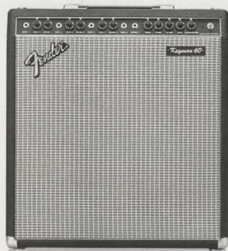
KEYMAN 60 ¥75,000

ずば抜けた表現力と創造性。感性の領域に大きく踏み込み、最新のトレンドに応じてゆくキーボードアンプ。