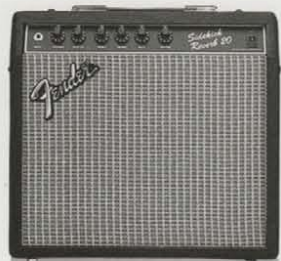
SIDEKICK REVERB 20 ¥36,000 ●出力=20W(RMS) 40W(PEAK) ●スピーカー=10インチ(25センチ)×1 ●コントロール=VOLUME, MASTER, TREBLE, MIDDLE, BASS, REVERB ●外形寸法・重量=407(W)×390(H)×210(D)mm 9kg ●消費電力=25W ●ヘッドホン端子、ラインアウト、USAアキュロニクス社製リバーブ、リバーベダル端子装備