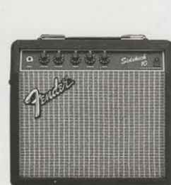
SIDEKICK 10 DELUXE ¥24,000 ●出力=10W(RMS) 20W(PEAK) ●スピーカー=8インチ(20センチ)×1 ●コントロール=VOLUME, MASTER, TREBLE, MIDDLE, BASS ●外形寸法・重量=345(W)×321(H)×190(D)mm 6.5kg ●消費電力=25W ●ヘッドホン端子、ラインアウト装備 ●SK10Dリバーブ装備、その他のスペックはSK10と同様です。