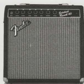
SIDEKICK REVERB 40 ¥43,800 NEW ●出力=40W(RMS) 80W(PEAK) ●スピーカー=12インチ(30センチ)×1 ●コントロール=VOLUME, MASTER, TREBLE, MIDDLE, BASS, PRESENCE, REVERB ●外形寸法・重量=424(W)×414(H)×232(D)mm 11kg ●消費電力=75W ●ヘッドホン端子、ラインアウト、エフェクターループ(センド/リターン端子)、USAアキュロニクス社製リバーブ、リバーベダル端子、USAアキュロニクス社製リバーブ装備