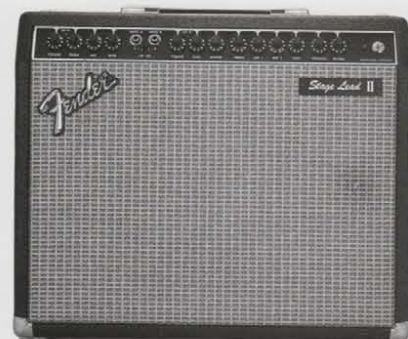
STAGE LEAD II 1-12 ¥95,000 NEW

●出力=100W(RMS) 200W(PEAK) ●スピーカー=12インチ(30センチ)×2 ●INPUT A, INPUT B, CH. SELECT スライドスイッチ ●CH. Aコントロール=VOLUME, TREBLE, MID, BASS ●CH. Bコントロール=VOLUME, GAIN, MASTER, TREBLE, MID1, MID2, BASS, PRESENCE, REVERB ●外形寸法・重量=665(W)×323(H)×273(D)mm 23kg ●消費電力=250W ●アセサリー=アンプアウト端子、ラインアウト端子、パワーアンプイン端子、USAアキュロニクス社製リバーブ、チャンネル切替リバーブON/OFF、フットペダル端子、チャンネル切替スイッチ、デュアルフットスイッチ