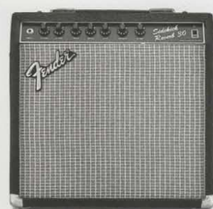
SIDEKICK REVERB 30 ¥39,800 ●出力=30W(RMS) 60W(PEAK) ●スピーカー=12インチ(30センチ)×1 ●コントロール=VOLUME, MASTER, TREBLE, MIDDLE, BASS, PRESENCE, REVERB ●外形寸法・重量=424(W)×414(H)×232(D)mm 11kg ●消費電力=75W ●ヘッドホン端子、ラインアウト、エフェクターループ(センド/リターン端子)、USAアキュロニクス社製リバーブ、リバーベダル端子装備