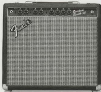
SIDEKICK REVERB 50 ¥55,000 ●出力=50W(RMS) 100W(PEAK) ●スピーカー=12インチ(30センチ)×1 ●コントロール=VOLUME, MASTER, TREBLE, MIDDLE, BASS, PRESENCE, REVERB ●外形寸法・重量=424(W)×414(H)×232(D)mm 11kg ●消費電力=75W ●ヘッドホン端子、ラインアウト、エフェクターループ(センド/リターン端子)、USAアキュロニクス社製リバーブ、リバーベダル端子、チャンネルセレクトフットSW装備