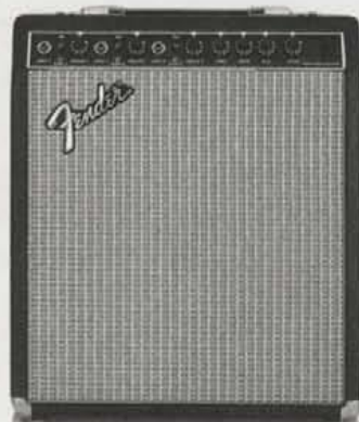
SIDEKICK KEYBOARD 35 ¥55,000

●出力=60W(RMS) 120W(PEAK) ●スピーカー=12インチ(30センチ)ウーハー×1、5インチ(12センチ)ツイーター×2 ●コントロール=3INPUT, LEVEL1,2,3, REVERB1,2,3, TREBLE, HI-MID, LOW-MID, BASS, MASTER REVERB, 3CHANNEL EFFECT SEND/RETURN ●外形寸法・重量=585(W)×521(H)×318(D)mm 25kg ●消費電力=155W ●プリアウト、メインイン、USAアキエトコックス社製リバーブ、リバーブペダルジャック装備